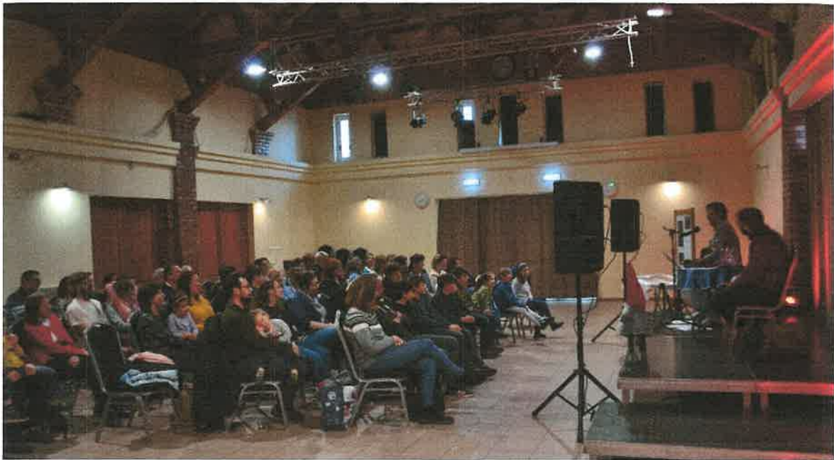
Zenés Ébresztő /2023.05.01