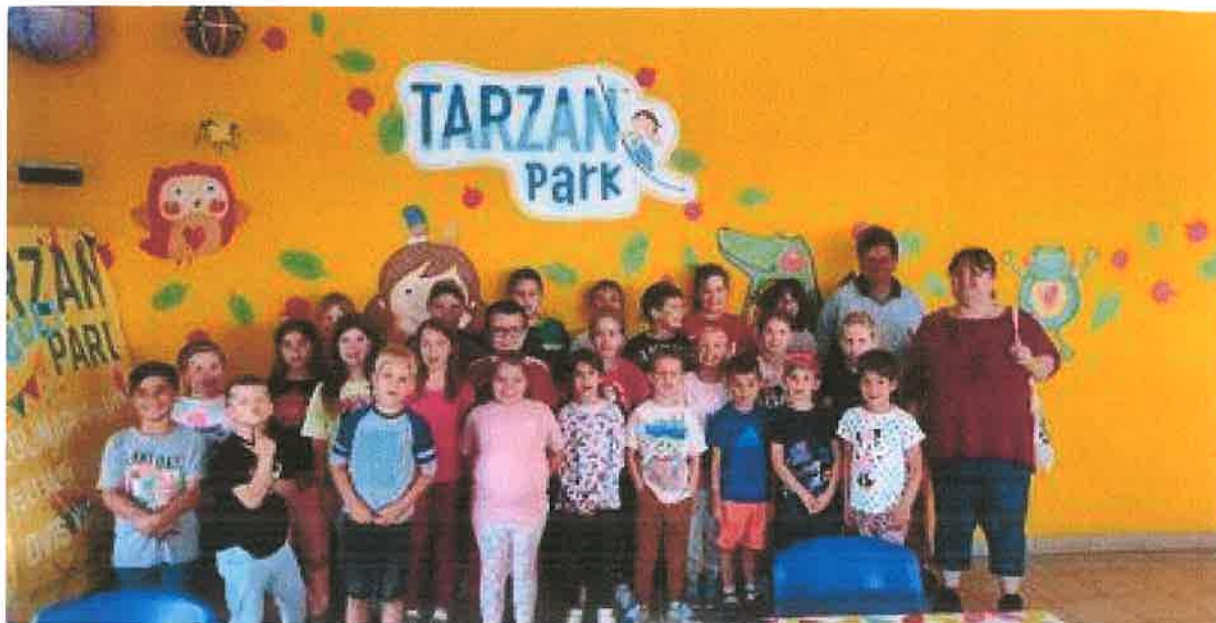
Szent István Nap / 2023.08.19.