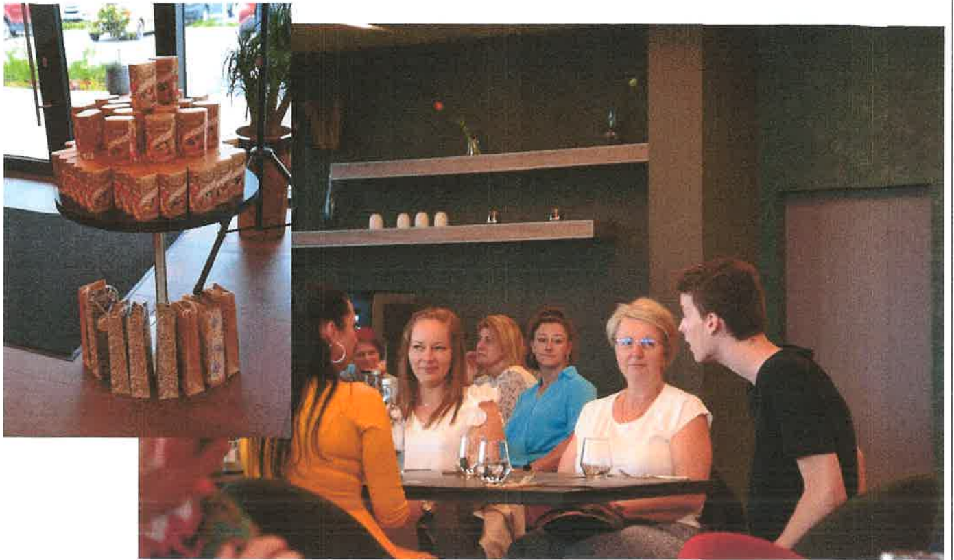
Méhecskés könyvtári óra / 2023.06.16.