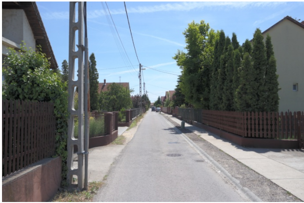
Ady Endre utca