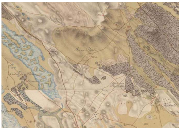
Első Katonai Felmérés (1763–1787)

A második katonai felmérésen is ezt látjuk, az Ócsai szőlő kiterjedt területe van közel a településhez, a lápos terület részben legelő, a síkság egy része szántóföldként hasznosított és a lakott területek jól kivehetők. Felső Inárcs a Nagy-erdőbe ágyazva alkot egy egységet, míg Alsó Inárcs – a Csíkos birtokközpont közelében a vízparton található. A tájat az Ócsát Újhartyánnal összekötő út szeli át, amely Felső Inárccsot elkerüli, míg Alsó Inárccs út melletti fekvésével jó pozícióba kerül.