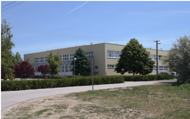
Tolnay Lajos Általános Iskola