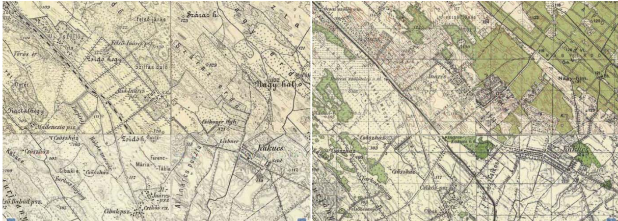
Harmadik Katonai Felmérés (1869–1887)