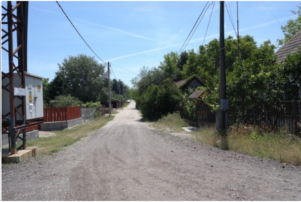
Virág utca (Bucka)