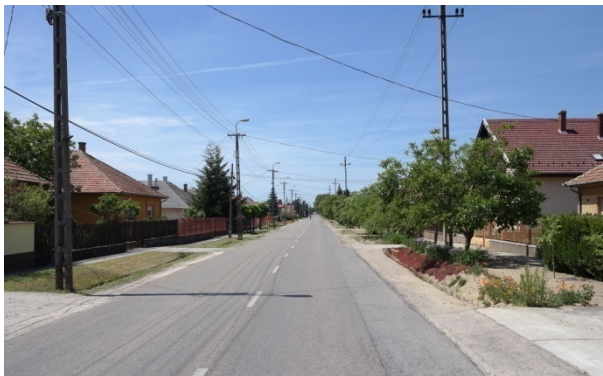
Széchenyi István út

A XX. század második felétől fokozatos és folyamatos át- és kiépülés jellemezte Inárcs központi belterületét. A hagyományos településkép, utcakép eltűnt, felbomlott. A településen nagyobb, összefüggő területre kiterjedően nem maradt meg régi településkép utcakép, jelen szabályozás ebben sem keletkezett változást. A régi anyaghasználatok tömegarányok épületformálások megőrzéséről a helyi építészeti védelem és a Települési Arculati Kézikönyv gondoskodik.