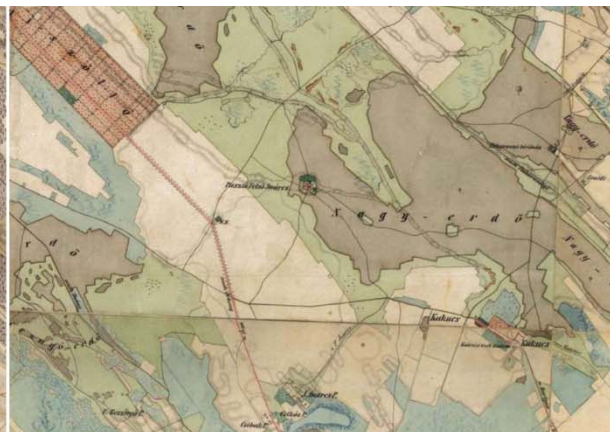
Második Katonai Felmérés (1806–1869)