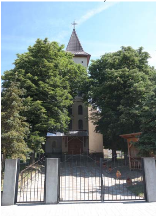
Inárcsi Szűz Mária Neve Templom

A közparkként használható kertrészek képviselnek értéket, nem a kialakításuk, nem a funkció gazdagságuk, hanem az idős térformáló faállományuk okán.