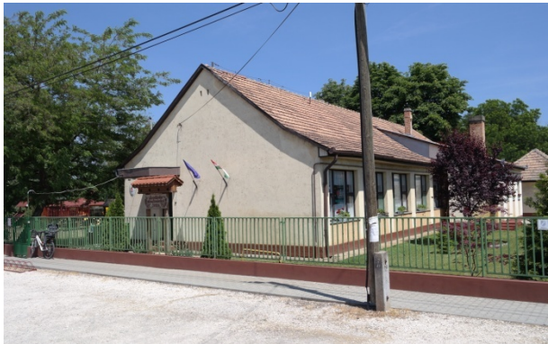
Boglárka Néphagyományőrző Óvoda

A földszintes megjelenés általánosnak és meghatározónak tekinthető. A belterületen a földszintes tömeg dominál a lakóépületeknél is és a lakófunkciót kiegészítő gazdálkodást szolgáló melléképületeknél is.