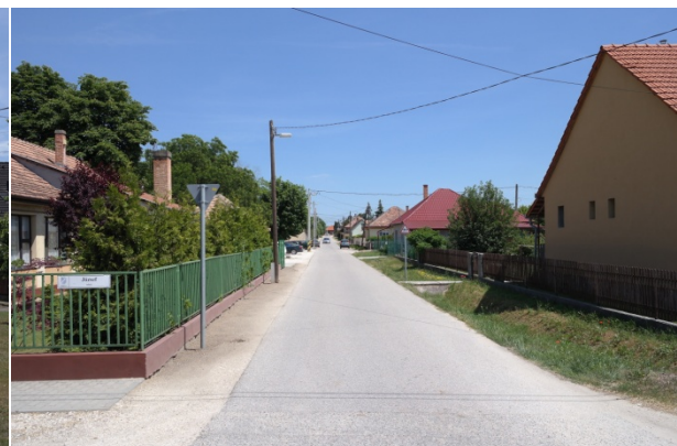
Fekiaács József utca